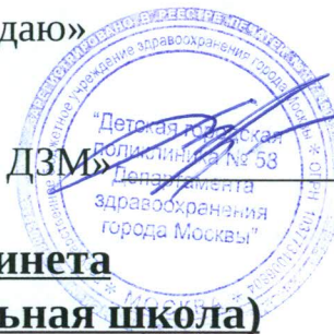
График работы медицинского кабинета ГБОУ «Немецкая школа № 1212» (начальная школа) на 2017-2018 учебный год