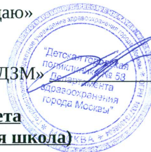
График работы медицинского кабинета ГБОУ «Немецкая школа № 1212» (старшая школа) на 2017-2018 учебный год